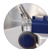
Snodo del manico