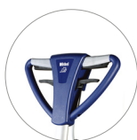
Impugnatura vista fronte